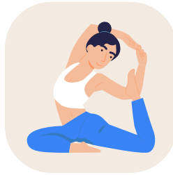
Clases de yoga online (Live)