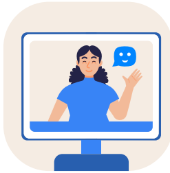
Terapia psicológica en línea

Te brindamos las herramientas para cuidar su bienestar: