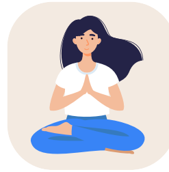
Cápsulas de Yoga y Audios de Meditación