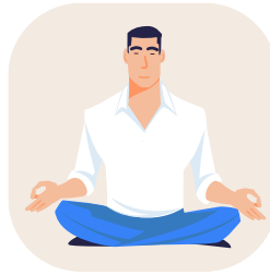
Sesiones de Mindfulness online (Live)